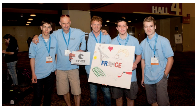
L'équipe du lycée Vauvenargues, lauréate au concours ISEF à Phoenix, en mai 2016.

L'équipe du lycée Vauvenargues d'Aix-en-Provence, lauréate des XXIII es Olympiades de Physique France en janvier 2016 ( Reflets de la physique n°50 (septembre 2016), p. 41), a participé au concours international Intel ISEF qui s'est déroulé du 8 au 13 mai 2016 à Phoenix (Arizona).