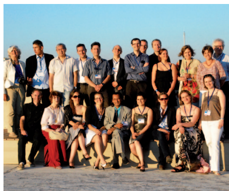
Le comité d'organisation du congrès