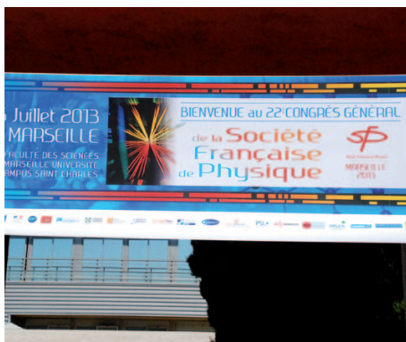
La banderole de bienvenue