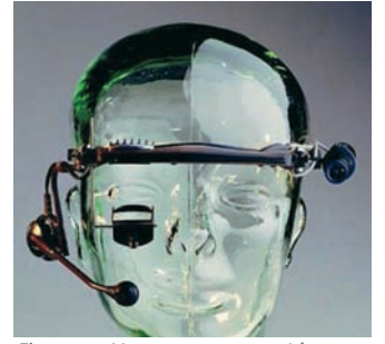
Figure 4 : Homme « augmenté »

les contrats de recherche comme ceux de l'ANR, devraient être accompagnés d'un volet portant sur l'impact social des recherches ; ils prendraient ainsi exemple sur les projets financés par la Commission Européenne, qui sont soumis à une évaluation éthique. Une sensibilisation de la communauté des scientifiques doit démarrer : les programmes des réunions scientifiques – comme, par exemple, les Journées de la Matière Condensée de la SFP – devraient comporter une séquence de débats sur les problèmes d'éthique évoqués ci-dessus. ■